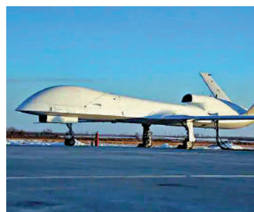
▲WJ-700是高空高速長航時察打一體無人機。

「鯤龍」AG600M全狀態新構型滅火機將首次亮相；陸軍首次派出現役直升機參展並進行飛行展示；空軍將派出以「20」為代表的現役裝備，包括運油-20。