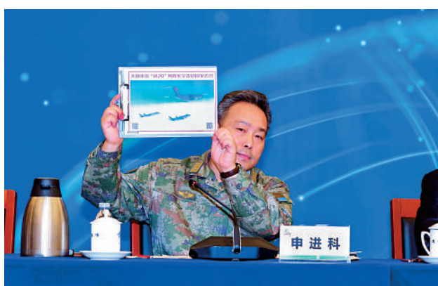
▲申進科大校展示運-20及殲-20的照片。