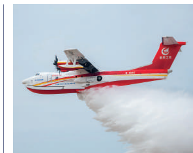
▲27日，AG600M完成12噸汲汲水試驗。