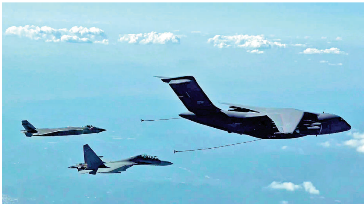
▲空軍新一代空中加油裝備運油-20（右）將現身第十四屆中國國際航空航天博覽會。

軍事專家宋忠平表示，中國航展實際上是綜合防務展，陸海空天電各方面軍民裝備都有，不僅是把中國產品推向市場的平台，更可以說是中國航空航天軍事實力的一次綜合展示，所以「中國要把好東西都拿出來」。