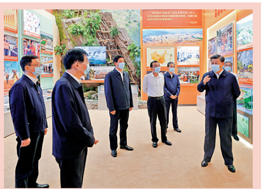
▲▲27日，黨和國家領導人習近平、李克強、栗戰書、汪洋、王滬寧、趙樂際、韓正等在北京展覽館參觀「奮進新時代」主題成就展。

到北京展覽館，走進展廳參觀展覽。展覽緊扣「奮進新時代」這一主題，以黨的十八大以來以習近平同志為核心的黨中央治國理政為主線，聚焦新時代10年黨和國家事業的偉大成就、偉大變革，既展現事業發展的新局新貌，又揭示變革背後的力量和動能；既展現新時代中國共產黨人的政治引領、思想指引，又反映廣大人民群眾團結一心、幹事創業的良