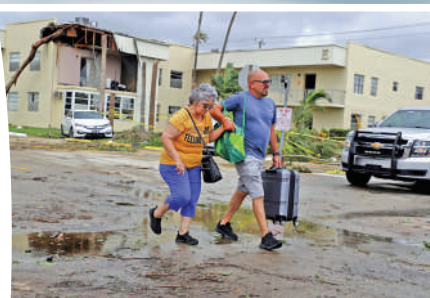
▲佛州保險業式微，民眾房屋受損後難以獲得賠償。