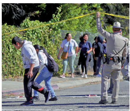
▲加州一所高中28日發生校園槍擊案，導致6人受傷。