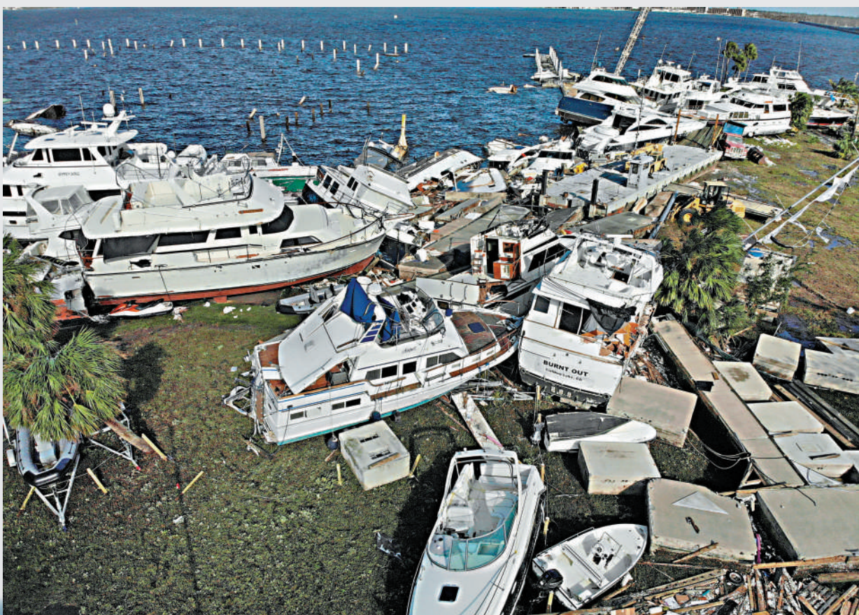
颶風「伊恩」29日席捲佛州，在當地造成大面積破壞。