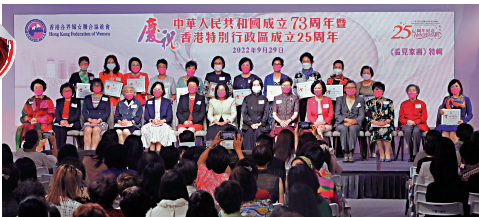
香港各界婦女聯合協進會昨日在信德中心舉辦「慶祝中華人民共和國成立73周年暨香港特別行政區成立25周年」活動。

香港各界婦女聯合協進會昨日在信德中心舉辦「慶祝中華人民共和國成立73周年暨香港特別行政區成立25周年」活動，香港特區行政長官夫人、香港婦協名譽贊助人李林麗輝在活動上致辭時表示，臨近國慶，香港社會充滿歡樂氣氛。在香港，女性可謂是「頂住半邊天」，持家有道又事業有成，在不同範疇中各領風騷，她祝賀獲特區授勳的婦女代表，又感謝香港婦協為香港社會和諧發展作出貢獻，別具意義，值得市民支持，相信香港婦協能繼續努力同為香港開新篇。