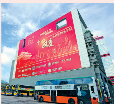
巨型國慶標語出現在全港多處地方，格外搶眼。