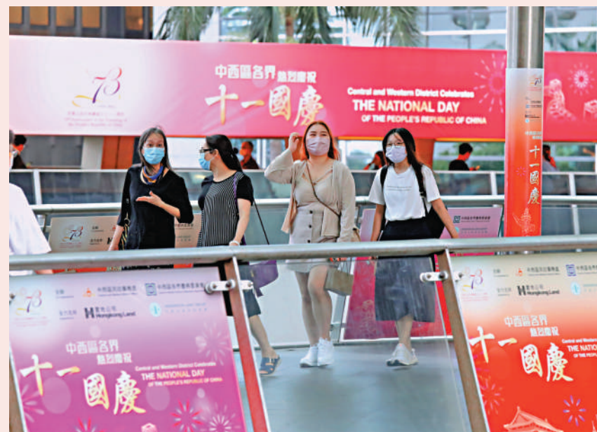
全港各區布置了各式各樣裝飾，慶祝國慶。

除了區內城鄉各處主要地標的慶祝橫額、花牌及彩旗陣列之外，熙來攘往的沙田區社區會堂、尖山隧道和大老山隧道出入口，以及通往港鐵沙田站的行人通道均布置了國旗旗海，盡顯莊嚴的國慶氣氛；白石角和馬鞍山海濱長廊，以及糅合了吐露港美景的馬鞍山公園海洋廣場的國慶裝飾亦不遑多讓，處處展現出瑰麗的自然風光與飛揚的紅色喜慶神采。此外，區內多處校舍、屋邨、屋苑、體育館及公園也紛紛為國慶張燈結綵，同賀國慶。