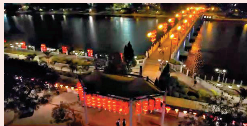
沙田公園城門河畔的國慶光影裝置最為矚目。