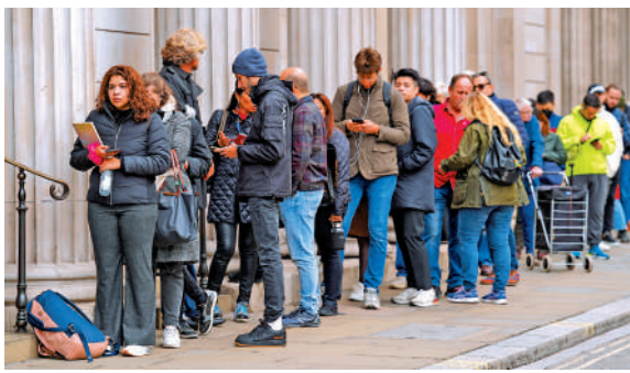
▲英國民眾9月30日在倫敦一間銀行前排隊。

工黨黨魁斯塔默日前批評特拉斯的減稅措施「根本是豪賭，就像是賭場的賭徒，追逐着失敗，但他們不是用自己的錢賭博，而是用我們的錢去賭」。他表示，在連續四次選舉失利後，現在是工黨自2010年以來贏得政權的最佳時機。