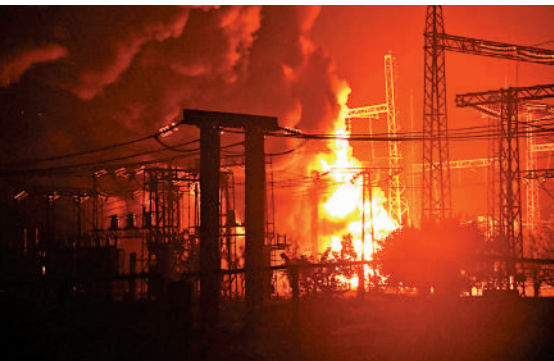
▲尼古拉耶夫地區9月30日遭導彈襲擊，火光冲天。

中國外交部9月30日表示，中方始終主張各國的主權領土完整都應該得到尊重，聯合國憲章的宗旨和原則都應該得到遵守，各國合理安全關切都應該得到重視，一切有利和平解決危機的努力都應該得到支持，希望各方通過對話協商妥善解決分歧。