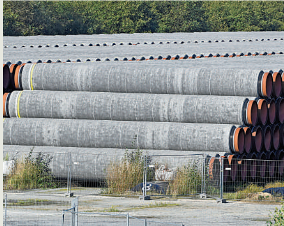
▲堆積在德國穆克蘭港未使用的「北溪」管道。

除了俄烏衝突外，過去一個月以來，亞美尼亞與阿塞拜疆、吉爾吉斯斯坦與塔吉克斯坦都先後發生衝突。亞美尼亞與阿塞拜疆常年就邊境納卡地區的歸屬問題交火，最新一輪衝突造成雙方逾百人喪生。兩國多次達成停火協議，但又很快互相指責對方推翻協議。克宮稱，雖然普京會盡一切努力幫助緩和緊張局勢，但外界不應高估俄羅斯和普京個人在斡旋兩國衝突上的作用。