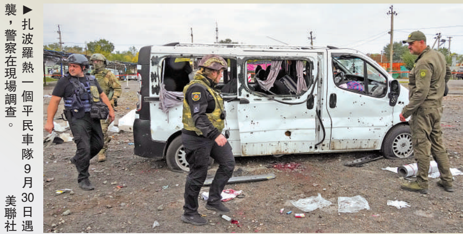
▲扎波羅熱一個平民車隊9月30日遇襲，警察在現場調查。