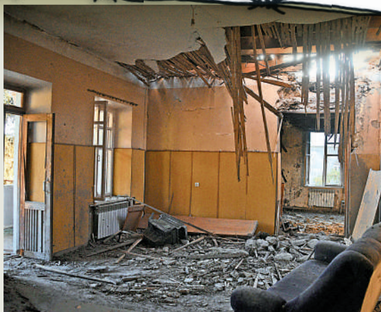
▲亞美尼亞和阿塞拜疆上月在邊境交火，圖為邊境城鎮一間被炸毀的房子。