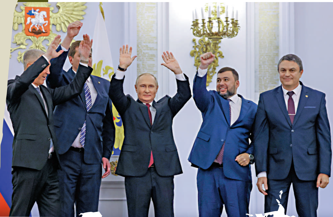
▲俄羅斯總統普京（中）9月30日在克宮會見入俄的四地領導人。美聯社

【大公報訊】綜合美聯社、《紐約時報》、俄新社報道：當地時間9月30日，俄羅斯總統普京在克里姆林宮與頓涅茨克、盧甘斯克、赫爾松、扎波羅熱四個地區的領導人簽署了這些地區加入俄羅斯聯邦的條約。普京在簽約儀式前表示，這四個地區與俄羅斯有着共同的命運，那裏的民眾已做出明確選擇，俄羅斯將「確保新領土的安全」。烏克蘭總統澤連斯基宣布，烏克蘭將遞交申請，希望通過「快速程序」加入北約。分析指，俄烏衝突將進入「危險的新階段」。