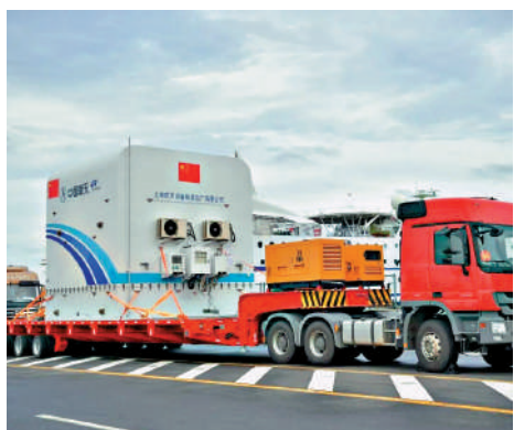
▲中國空間站第2個實驗艙段——夢天實驗艙於8月運抵文昌航天發射場。

爲讓問天艙轉位過程變得更加平穩、順利，研製團隊幾經論證，並綜合對比國際空間站轉位方案，創造性提出「平面式轉位方案」，這是國際上首次以平面式轉位方案完成航天器的轉位動作。魏智介紹道，俄羅斯「和平號」空間站採用的是翻轉式組裝方案，但這一方案在艙體轉位到位後，艙體姿態會發生90°的翻轉，而此次中國採用的方案則