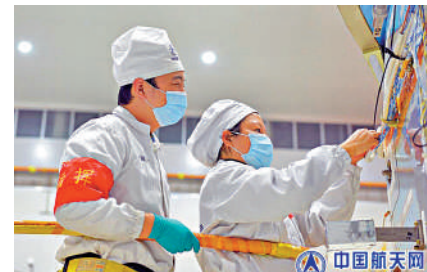
▲中國航天科技集團八院夢天實驗艙試驗隊員進行總裝操作。

眼難以察覺的速度實現艙體緩慢起動，並逐漸提高至全速轉動。在即將到側向停泊點時，轉臂開啟「制動」模式，爲了避免電機斷電可能帶來的「急剎車」，轉臂上安裝了緩衝耗能裝置，既可以避免大慣量衝擊造成「小臂骨折」，又能在三分鐘內快速消耗艙