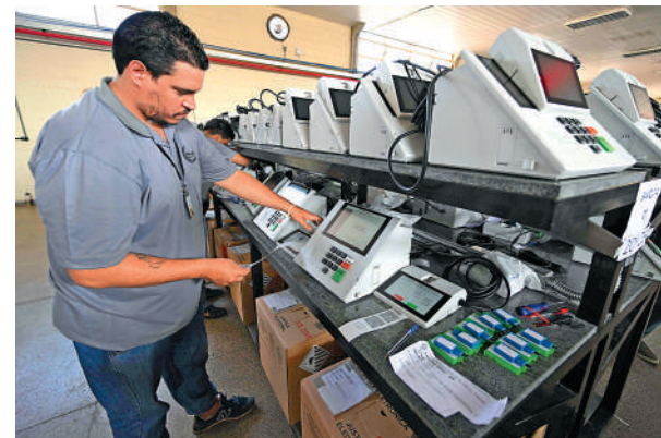
▲工作人員為選舉準備電子投票器。

【大公報訊】綜合法新社、《紐約時報》報導：分析人士認為，2018年博索納羅能夠勝選，部分原因是他針對政敵發動的假新聞攻勢奏效。而四年後的這次大選，社交媒體上的假消息依舊猖獗。巴西當局成立了「最高選舉法院」(TSE)進行監督，與社交媒體平台合作下架不實影片和訊息，但效果有限。 隨著2022大選進入白熱化，不斷有假消息稱盧拉嚴重酗酒，或當選後將關閉教堂，還有消息宣稱博索納羅在2018年並沒有遭到刺殺。博索納羅更是一直稱電子投票系統存在舞弊現象，雖然他沒有任何證據。 博索納羅陣營被控建立了一個叫作Lulaflix的網站，專門傳播有關盧拉的假消息。以「了解前總統的真相」為噱頭吸引讀者，點開詞條，會搜索到例如「盧拉再次為那些偷手機的人辯護」、「盧拉說他被無罪釋放，但司法系統問題重重」等內容。盧拉的競選團隊稱，該網站在谷歌搜索中位於前列。 「最高選舉法院」承認，2018年博索納羅當選時假新聞很多，並承諾這次不會讓該現象重演。不過，巴西利亞大學新聞學教授庫哈認為，巴西社會對抗假消息的行動才剛開始，「只有很少民眾會主動質疑這些假消息」。