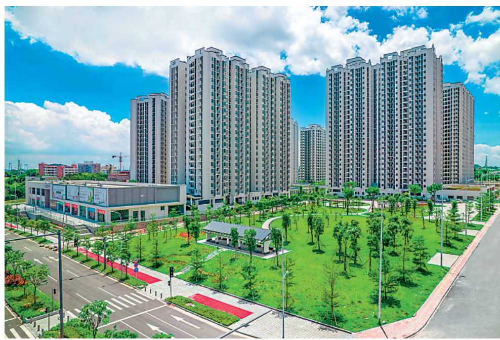
▲廣州的城雋雅苑北區提供2386伙共有產權房。