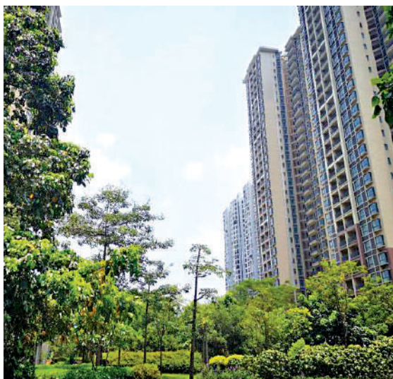
▲龍歸花園共有產權房小區。