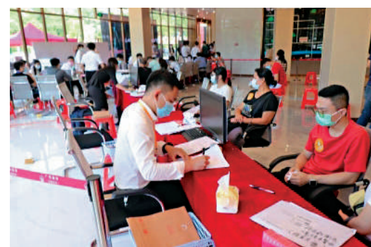
▲榕悅花園共有產權房銷售反應熱烈。

雖說不是100%產權，但這樣的價格，對於周邊二手房每平米均價超過2萬元來說，十分有吸引力。該項目在開放申請後，在節假日的日均接到來訪人數就超過2500人次，不少參觀人士更願意排隊20分鐘；當時大部分到訪者更青睞約85至88平米的3房1廳戶型。