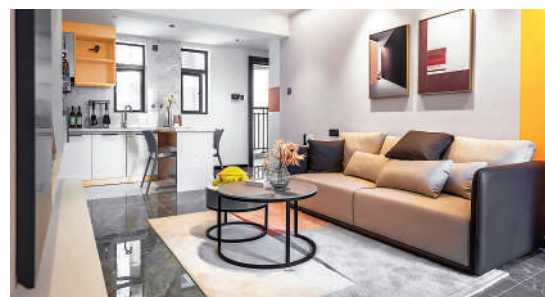
▲城雋雅苑北區項目帶裝修交樓。圖為現樓示範單位。