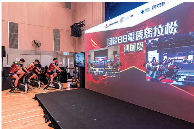
「回歸BB電競馬拉松迎國慶」以創新模式體現香港與內地密不可分的關係。

未來五年是香港發展的關鍵期，青年興，則香港興，香港青年要加緊把握機遇，融入國家發展大局。