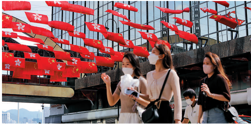
青年決定香港以至國家的未來，即便是最平凡的工作，也能為祖國貢獻力量。

我們應該在奮鬥中增添青春的分量。收穫總是與耕耘相伴，勝利總是與拚搏同行。真至深的家國情懷，也一定沉澱於艱辛的付出。「看似尋常最奇崛，成如容易卻艱辛」，在這樣的日子裏，我常常想到中華大地上，奮鬥精