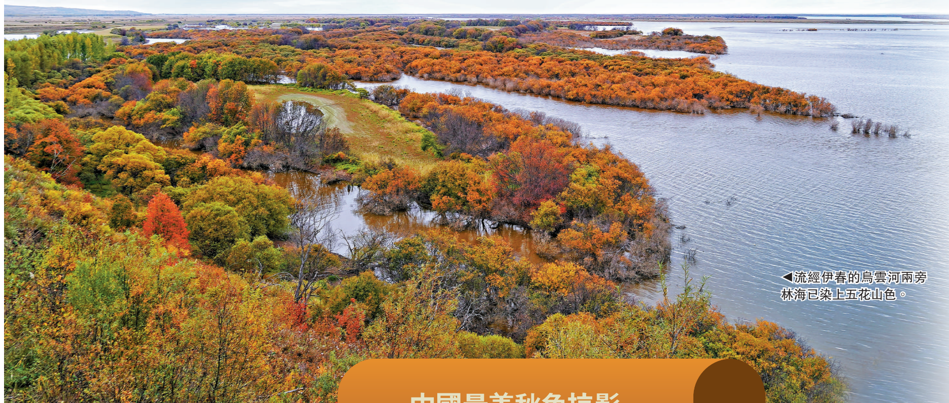
◀流經伊春的烏雲河兩旁林海已染上五花山色。