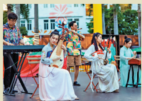
▲深圳市民國慶假期可以在家門口欣賞民樂表演。

「中國·正當潮」為主題的國潮節，打造了「國潮yo鋪」「童話奇幻」等潮拍互動站點，互動站點還有「俠客」「森林仙子」等國風COSER近距離互動。歡樂谷各大舞台上演國潮民樂、國風街舞、街頭魔術秀等近百場精彩表演，為遊客打造一場國潮視聽盛宴。值得一提的是魔術大秀，國內外知名魔術和滑稽大師帶來30餘場表演。