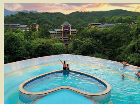
▲遊客在地派溫泉心形泳池打卡。