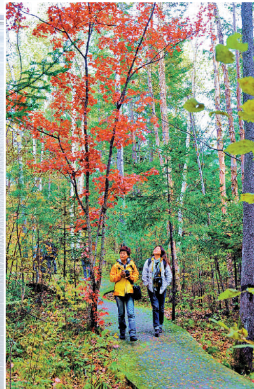
◀走在伊春的森林公園中，彷彿人在畫中遊。