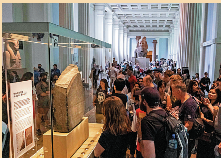
▲被視為大英博物館鎮館之寶的羅塞塔石碑。