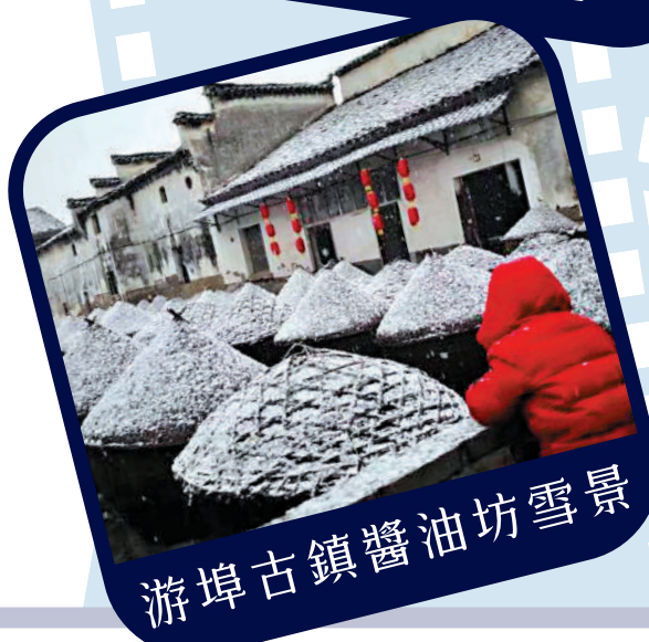
游埠古鎮醬油坊雪景