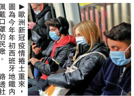
▲歐洲新冠疫情影响捲土重來，佩戴口罩的民眾。

【大公報訊】據路透社報導：歐洲新一波新冠疫情或捲土重來。世界衛生組織近日表示，在檢測數量大幅下降的情況下，歐洲上周新增確診病例高達150萬，較上周增加8%。目前，Omicron亞變種