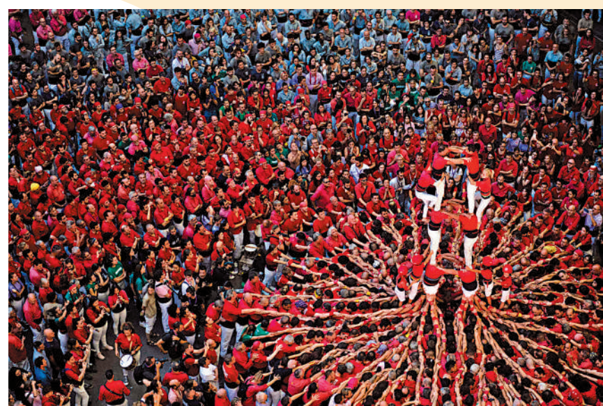
▲10月2日，西班牙塔拉戈納門牛場舉行疊羅漢比賽。

紐約9月份公共運輸攻擊事件和去年同期相比，大幅增加16.8%。早前，不少民眾因為憂慮紐約地鐵治安問題，直言「晚上7點後不敢乘坐地鐵。」9月20日，紐約市大都會交通局宣布，在2025年之前，紐約地鐵列車總計約6400節車廂將全部安裝監控攝像頭，每節車廂兩個。