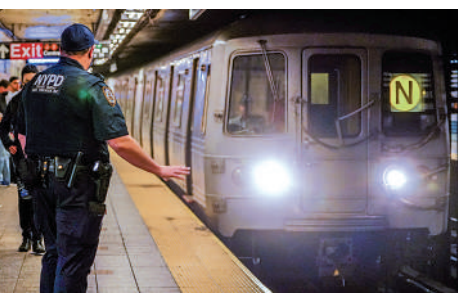
▲紐約地鐵襲擊案頻發，一名反恐警察在月台向司機示意。

【大公報訊】綜合《紐約郵報》、《華盛頓郵報》報導：美國紐約市曼哈頓地鐵近日發生多宗地鐵襲擊事件，被襲擊者或在站台被刀捅傷、或被推入地鐵鐵