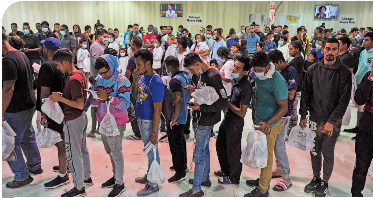
▲大批尋求庇護的移民排隊等待前往紐約和芝加哥的巴士。

外界質疑，把移民當「人球」踢來踢去的做法，令非法移民淪為政治犧牲品。共和黨指責民主黨人「偽善」，在移民問題上說得好聽，等移民真的來了又不斷抱怨。阿博特稱，「紐約市所經歷的只是得州邊境城市每天所面臨難題的一小部分而已。」阿博特表示，將繼續向紐約市、華府、芝加哥輸送非法移民，以緩解不堪重負的邊境地區，「直到拜登履行他的職責，確保邊境安全」為止。