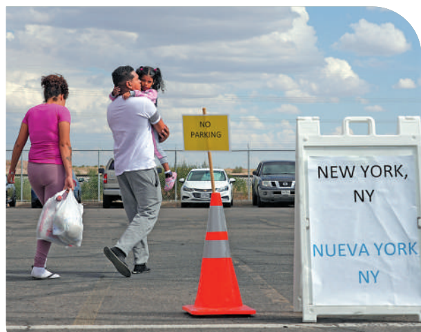
▲來自委內瑞拉的非法移民與妻兒在得州埃爾帕索市登上前往紐約的巴士。

【大公報訊】綜合路透社、BBC、《紐約郵報》報導：美國11月中期選舉臨近，美國共和黨與民主黨政治鬥爭日趨激烈，非法移民被當成政治武器。美國紐約市長亞當斯7日宣布，由於過去幾個月從南部邊境地區轉運來的非法移民數量超出當地應對能力，紐約市從即日起進入為期30天的緊急狀態。共和黨近期用巴士或飛機空投非法移民到民主黨人的主導地區，甚至直接送到副總統的官邸外，引發爭議。