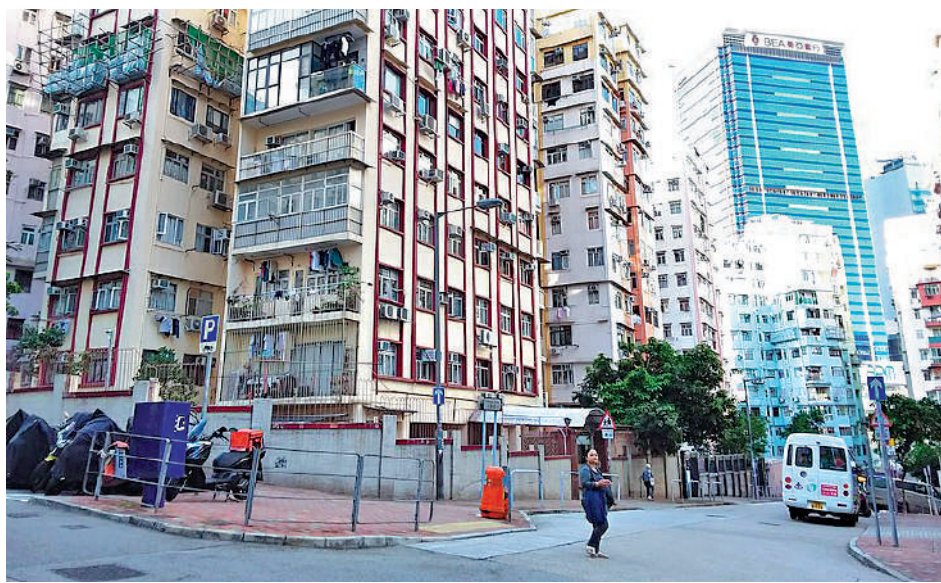
◀許家民團隊曾選擇觀塘月華街一處高層住宅單位作為觀察場地。