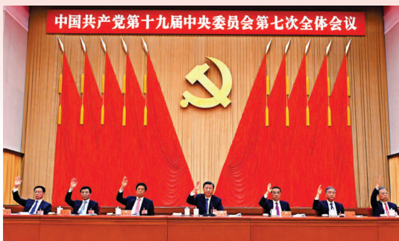
中國共產黨第十九屆中央委員會第七次全體會議，於2022年10月9日至12日在北京舉行。這是習近平、李克強、栗戰書、汪洋、王滬寧、趙樂際、韓正等在主席台上。

全會充分肯定黨的十九屆六中全會以來中央政治局的工作。全會總結了黨的十九屆六中全會以來的工作。全會強調，黨的十九屆六中全會以來5年黨和國家事業的重大成就，是在以習近平同志為核心的黨中央堅強領導下、在習近平新時代中國特色社會主義思想指引下全黨全國各族人民團結奮鬥取得的。黨確立習近平同志黨中央的核心、全黨的核心地位，確立習近平新時代中國特色社會主義思想的指導地位，反映了全黨全軍全國各族人民共同心願，對新時代黨和國家事業發展、對推進中華民族偉大復興歷史進程具有決定性意義。