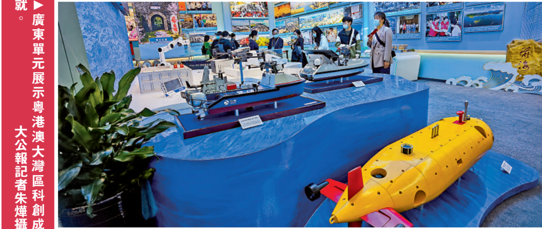
廣東單元展示粵港澳大灣區科創成就。