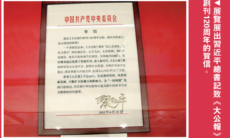
「展覽展出習近平總書記致《大公報》創刊120周年的賀信。