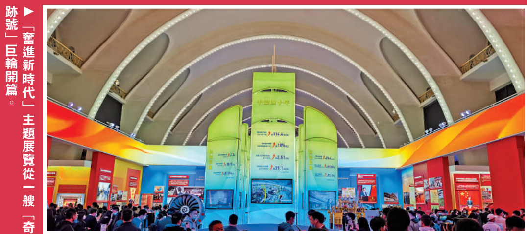
「奮進新時代」主題展區從一艘「奇跡號」巨輪開篇。