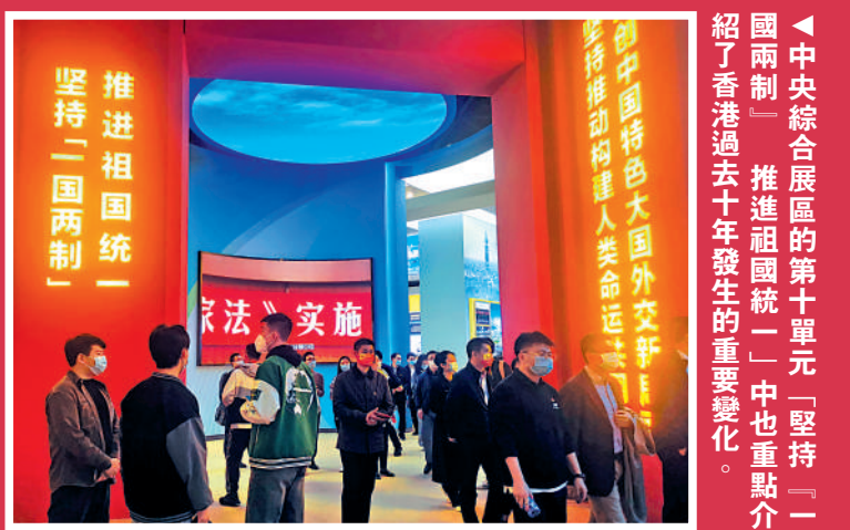
觀眾在參觀涉及香港內容的展覽。