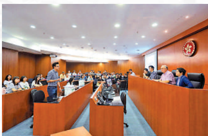
◀中大法學課程的同學在模擬法庭學習法庭審訊實務。

以香港中學文憑考試成績申請法學學士課程的申請人必須達到英文5分、中文4分，數學、通識教育、一門選修及數學選修均須達到3分。