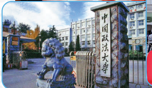
▲中國政法大學的法學專業於2022軟科中國學科排名第一位。

◀近年愈來愈多港生到內地高校修讀法學專業，以便畢業後更有利在內地發展。圖為內地高校在全國大學生模擬法庭競賽中辯論情形。