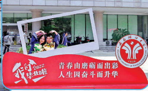
▲西南政法大學設有多個法學專業雙學士課程，着力打造複合型法學專才。