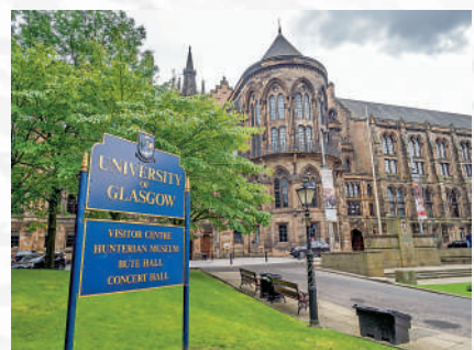
▲格拉斯哥大學的法學課程三年制，2023/24學年的課程於明年6月30日截止申請。

們最好的5門科目（包括至少2門選修課）來考慮。學位課程要求任何特定科目都應達到4分。如果數學是特定學科的要求，則必修部分和擴展部分都需要達到4分，其中英語4分將被接受以代替雅思，2023/24學年的申請將於2023年6月30日截止。