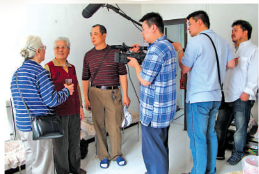
▲國家圖書館中國記憶項目中心東北抗日聯軍專題採訪現場。

打開國家圖書館官網，點擊重點項目欄，「中國記憶」赫然在列。2012年，「中國記憶」啟動首個專題——東北抗日聯軍專題資源建設工作。到2016年「九一八」事變爆發85周年之際，專題階段性成果35段口述史視頻在國圖網站集中推送給公眾，圖書《我的抗聯歲月——東北抗日聯軍戰士口述史》出版。在此期間，「中國記憶」項目團隊跑了7個省，採訪100餘位相關人士，其中包括20多位當時仍健在的抗聯戰士。