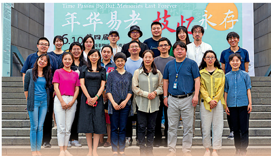
▲國家圖書館中國記憶項目中心部分成員合影。

十年來，我們努力記錄着「正在老去的生命、正在遠去的歷史、正在消失的文化和正被遺忘的故事」，並輔以出版、展覽、講座、文化活動等形式讓國人更深入地了解歷史。期待未來能承擔更多記憶保護工作，並建起方便公眾隨時調閱、查看的平台。