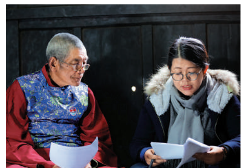
▲國家圖書館中國記憶項目中心採訪納西族東巴畫國家級非物質文化遺產傳承人。