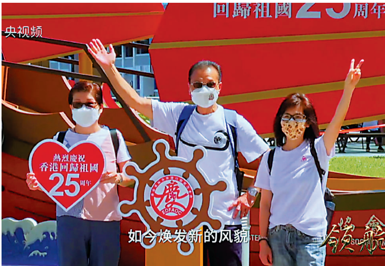
▲大型電視專題片《領航》第十三集《一國兩制》中展示香港市民慶祝香港回歸祖國25周年。