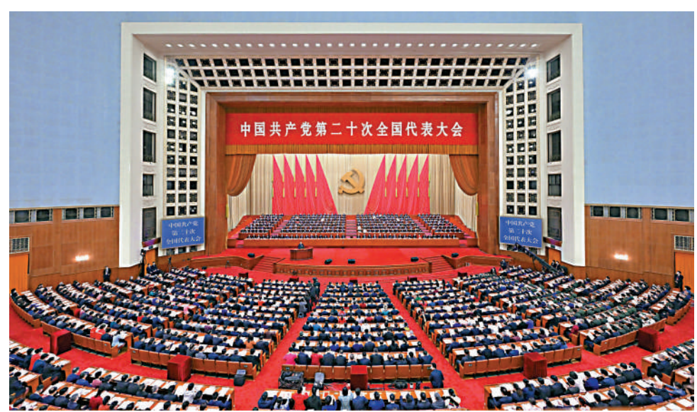
▲10月16日，中國共產黨第二十次全國代表大會在人民大會堂開幕。圖為大會會場。

——堅持發揚鬥爭精神。增強全黨全國各族人民的志氣、骨氣、底氣，不信邪、不怕鬼、不怕壓，知難而進、迎難而上，統籌發展和安全的，全力戰勝前進道路上各種困難和挑戰，依靠強項爭鬥開闢事業發展新天地。