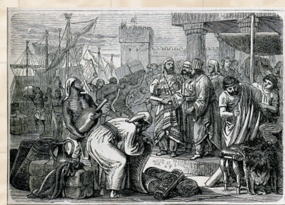
▲ 腓尼基人因地中海貿易而興起。

在書中，作者還以「無國之民如何改變世界歷史」為題，介紹了兩個特殊的「大流散」民族，一個是以中東為中心，主要在亞洲活動的亞美尼亞人，另一個是擁有跨越大西洋抵達亞洲的廣闊商業網絡、屬於伊比利亞系猶太人的塞法迪人。前者是在歐亞大陸多個地區經商的民族，從16世紀開始，他們就是著名的絲綢貿易商，17世紀後又深度介入印度的國際貿易，成為英國、荷蘭、法國、丹麥等國家在東印度貿易中不可或缺的