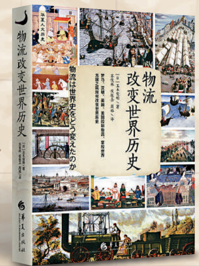
▲ 玉木俊明著，蘇俊林、侯振兵、周璐譯《物流改變世界歷史》簡體中文版，華夏出版社，2022年。