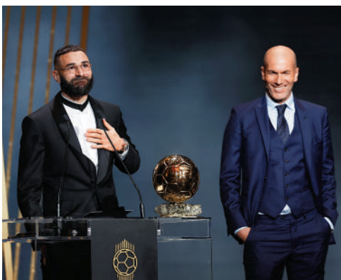
▲賓施馬（左）首度獲得金球獎殊榮。

皇馬門將高圖爾斯力壓利物浦的艾利臣比加，首獲耶辛獎。巴塞隆拿18歲新星加維歷倒今季加盟皇馬的法國中場卡馬雲加，獲得代表最佳年輕球員的高柏獎；羅拔利雲度夫斯連續兩年拿到易名為梅拿獎的最佳射手獎，曼城成為最佳球會。女子金球獎由巴塞女足的佩迪拿絲成功衛冕。