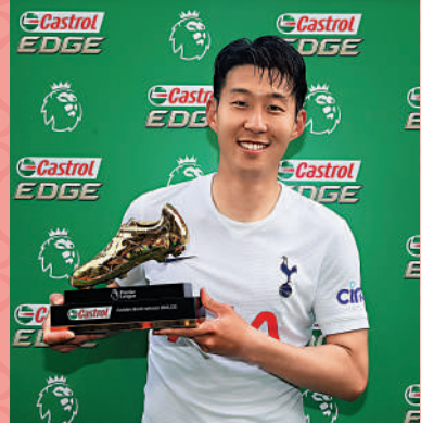
孫興民在二〇二一至二二年球季與沙拿分享英超神射手。資料圖片