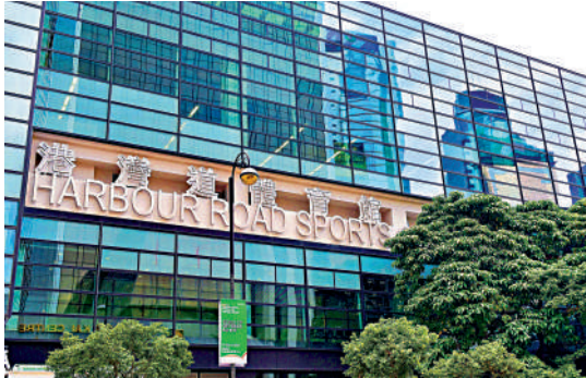
▲灣道體育館下月恢復開放

康文署表示，市民可按各館接受預訂日期，使用康體通網上預訂服務、已重開場地的訂場櫃檯及自助服務站，或到各分區康樂事務辦事處的訂場櫃檯預訂收費設施。