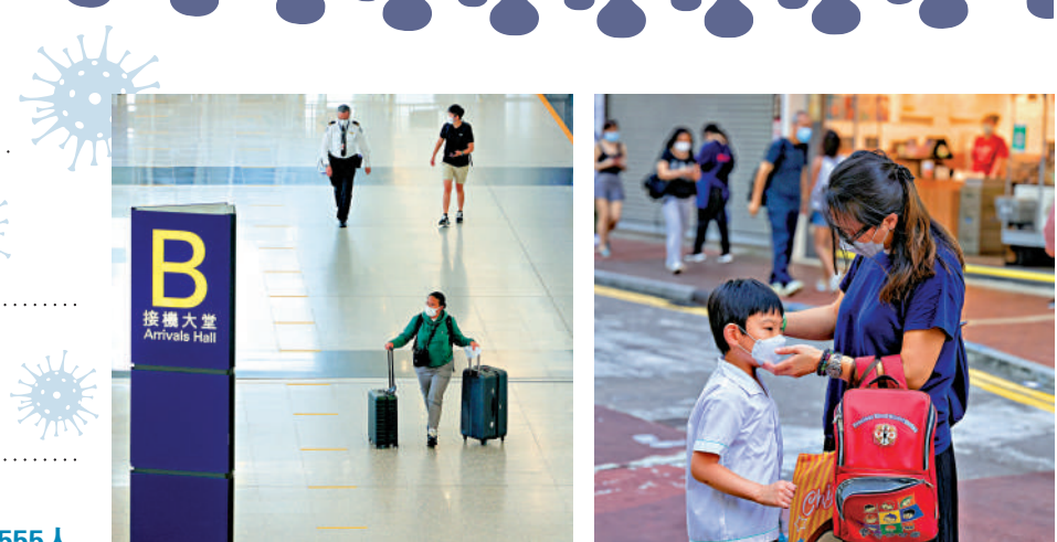
▲香港日前放寬入境檢疫措施至「0+3」，近日輸入個案上升。