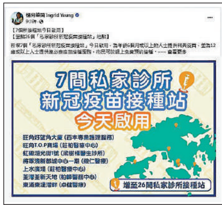
▲楊何蓓茵在社交網站表示，目前共有26間私家診所加入新冠疫苗接種計劃。

病和死亡率。7間私家診所昨日加入新冠疫苗接種計劃，公務員事務局局長楊何蓓茵在社交網站表示，目前共有26間私家診所加入計劃，當局在選址上花盡心思，特意在交通方便及人流暢旺地點增設接種點，冀滿足不同人士的打針需要，特別是便利長者和家長帶子女接種疫苗。