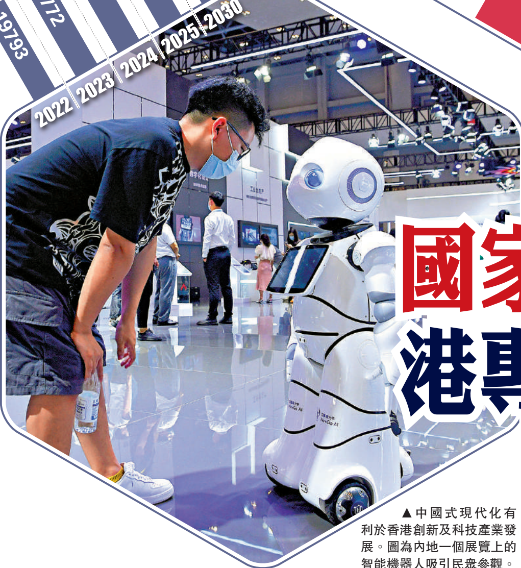
▲中國式現代化有利於香港創新及科技產業發展。圖為內地一個展覽上的智能機器人吸引民眾參觀。