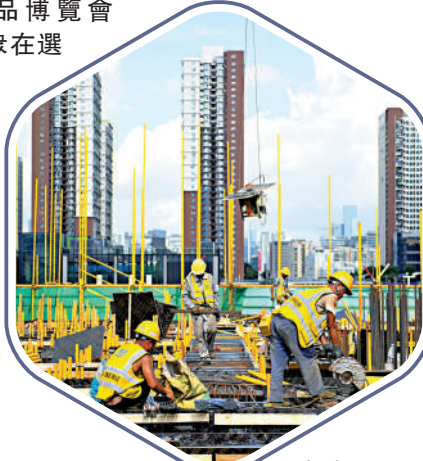
▲去年9月8日，施工人員在深圳前海交易廣場T4棟項目現場工作。新華社

根據「國際專案管理學會」定義：「專案管理」乃是將管理知識、技術、工具、方法綜合運用到任何一個專案行為上，使其能符合或超越「專案利害關係者」(Stakeholder)需求與期許的一種專門科學，所關切的是如何將一項任務能如期、如質及如預算的達成並充分滿足需求目標。