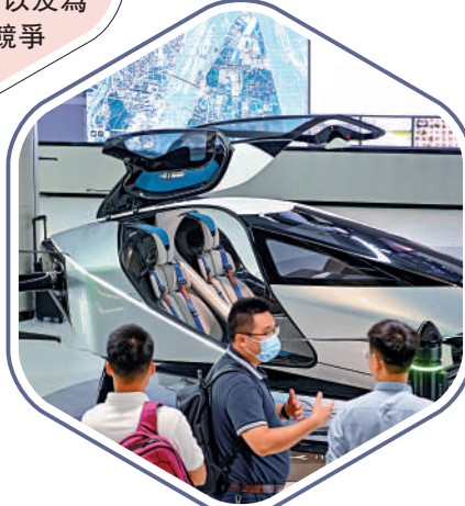
▲10月17日，飛行汽車「航旅者X2」在廣州展出。

把供應鏈各成員包括零售商、中間商、生產商、倉庫和配送中心等有效地組織在一起，而進行產品設計、製造、轉運、分銷及零售的管理方法，從而降低成本。現代供應鏈管理更包括端到端業務流程的戰略，以創造出更好的市場和經濟價值，以及為企業提供超越對手的競爭優勢。