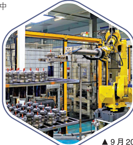
▲9月20日，在南昌經濟技術開發區一家企業智能工廠內，機器人在作業。

「再工業化」的關鍵是數碼轉型，善用數碼科技，協助企業創優增值，踏出「再工業化」的第一步。如建設智能工廠發展，在物聯網上打通系統與人、人與人之間的實時交流與合作渠道；所有文件電子化，業務通過電子形式進行，整套工序通過遙距形式進行，使營運更具效率。