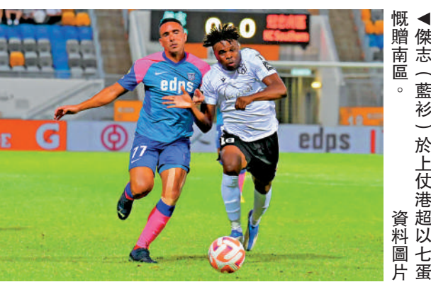
◀傑志（藍衫）於上仗港超以七蛋 戰南區。 資料圖片