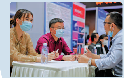
▲2021年3月15日，深圳人才集團預約式首場招聘會在羅湖舉行。