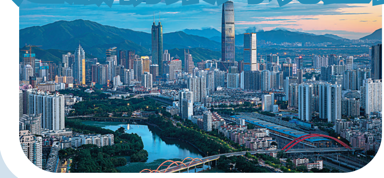
▲深圳羅湖區將加快片區改造，依託釋放的土地空間打造專業服務業跨境經營區。圖為羅湖區遠景。

實施方案中，專門針對要素跨境融通推出系列措施，提出了建設跨境機械通、數幣通、信用通、數據通等行