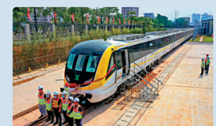
▲施工人員在深圳地鐵14號線首列電客車前留影。