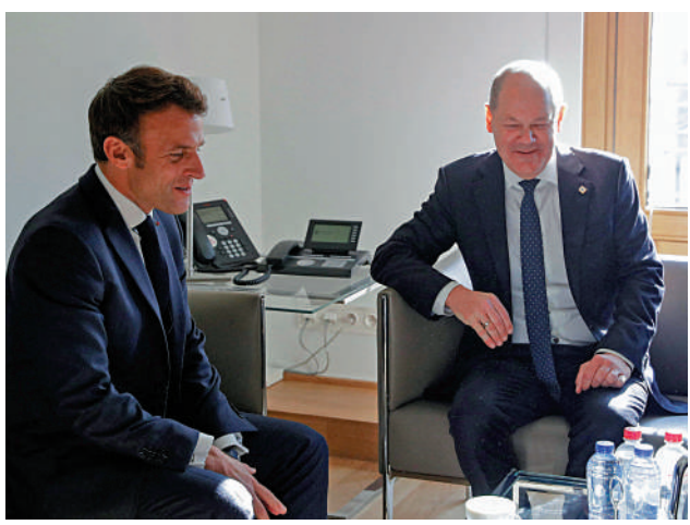
馬克龍（左）和朔爾茨在天然氣限價問題上意見相左。

法國總統府官員19日告訴媒體，法德兩國將原定下周舉行的年度部長級會議推遲至明年1月，因為雙方需要更多時間就能源政策、防務合作等問題達成一致。