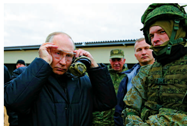
普京20日視察軍事基地，了解動員人員受訓情況。

普京20日視察了俄羅斯中部梁贊州一處軍事基地，了解俄動員人員進行軍事訓練的進展，展現對增兵前往烏克蘭戰場的決心。俄媒公布的視頻顯示，他戴上護目鏡和耳機，在偽裝網下試射新研發的SVD狙擊步槍。他還查看了士兵背包內的裝備，並與一名士兵擁抱。