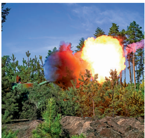
西方國家向烏克蘭提供大量軍火，其中一部分可能已流入黑市。

麥卡錫日前接受採訪時稱，若共和黨奪回眾院，人們不應該想當然地認為美國將向烏克蘭提供進一步軍事援助。他批評民主黨政府忽視了美國國內的問題。據彭博社報道，世界首富馬斯克頻繁就烏克蘭問題發聲，令美國政府不滿，當局正在討論是否對馬斯克的部分商業項目進行國安審查，包括推特收購案和「星鏈」系統。