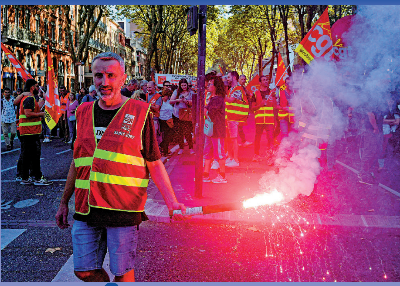
法國能源價格飆升，生活成本危機加劇，引爆大規模示威和罷工。

歐盟各國領導人20日就如何降低能源價格激辯11小時，最終僅取得空泛共識。歐盟委員會主席馮德萊恩稱，峰會制定了「繼續就能源價格議題展開討論」的路線圖。歐盟官網的公開文本顯示，各國敦促歐盟委員會和歐洲理事會盡快就「額外措施」提交「具體決定」。這些額外措施包括設立臨時動態天然氣價格區間、制定能夠更好反應液化天然氣價格波動的新指數，以及推出基於自願原則的聯合採購天然氣機制等。