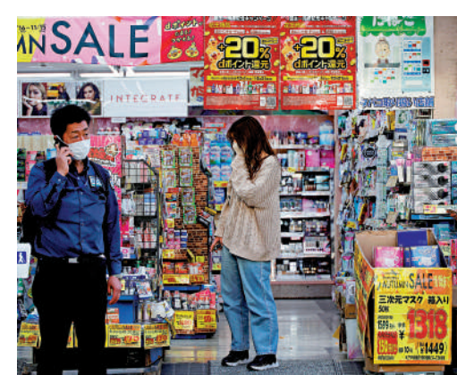
日本物價上漲，企業和消費者感到沉重壓力。路透社

今年美聯儲持續激進加息，多國央行選擇跟進以對抗通脹壓力，但日本央行承諾保持超低利率。路透社指，物價上漲令日本央行的政策面臨嚴峻考驗。