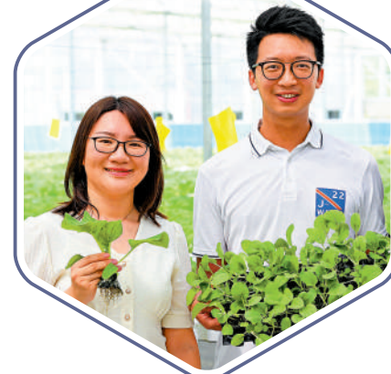
在廣東江門開平市國家現代農業示範區，幾位香港青年創設了自己的魚菜共生生產基地。 新華社

暨南大學特區港澳經濟研究所副所長、經濟學院教授謝寶劍告訴大公報，在中國式現代化建設進程中，粵港澳大灣區擁有人工智能、數字經濟、金融科技、生命科學、航空航天、質量品牌等眾多高精尖領域，將為香港青年發展開闊廣闊發展空間。