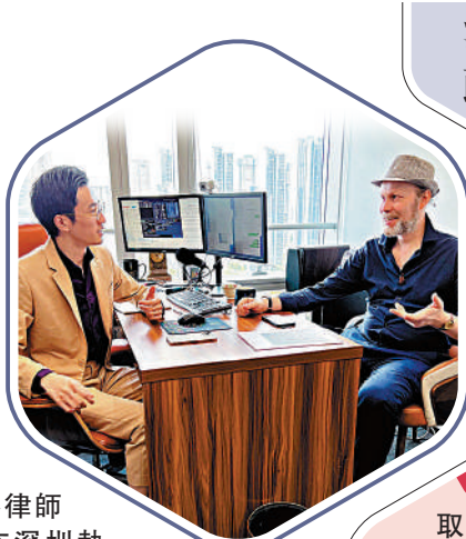
香港律師(左)在深圳執業，受到外國客歡迎。