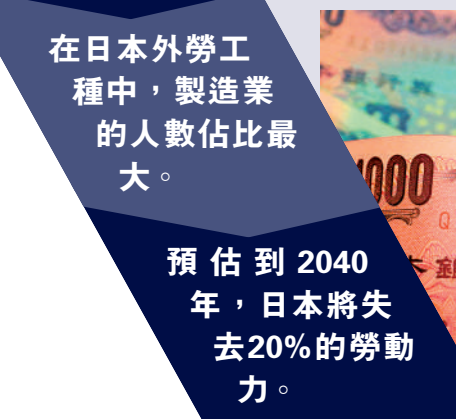
▲日圓近期急速貶值，20日一度跌破1美元兌150日圓大關。