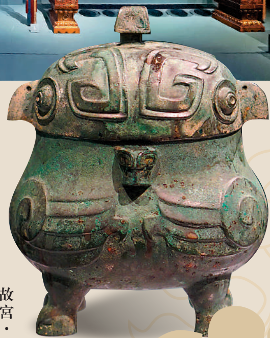
▶「大展」展品：殷商青銅鸞卣。山西省博物院

國慶節後10月8日，「和合中國」大展又在瀋陽遼寧省博物館開幕（下文簡稱「大展」），此展由22個文博機構共同協辦，是遼博史上規模最大的特展，旨在展現中華民族傳統的「和合」思想。