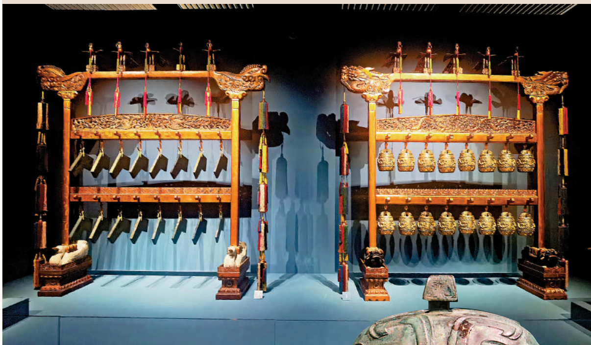
▲「聯展」展品：清乾隆青玉描金雲龍紋編磬（左）、清乾隆銅鑲金編鐘。故宮博物院