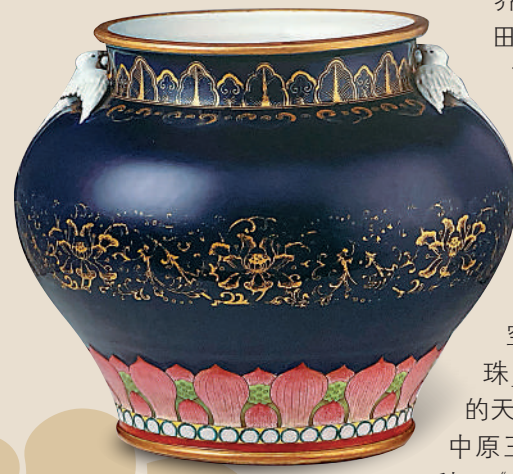
▼「聯展」展品：清乾隆青釉金彩海晏河清尊。中國國家博物館