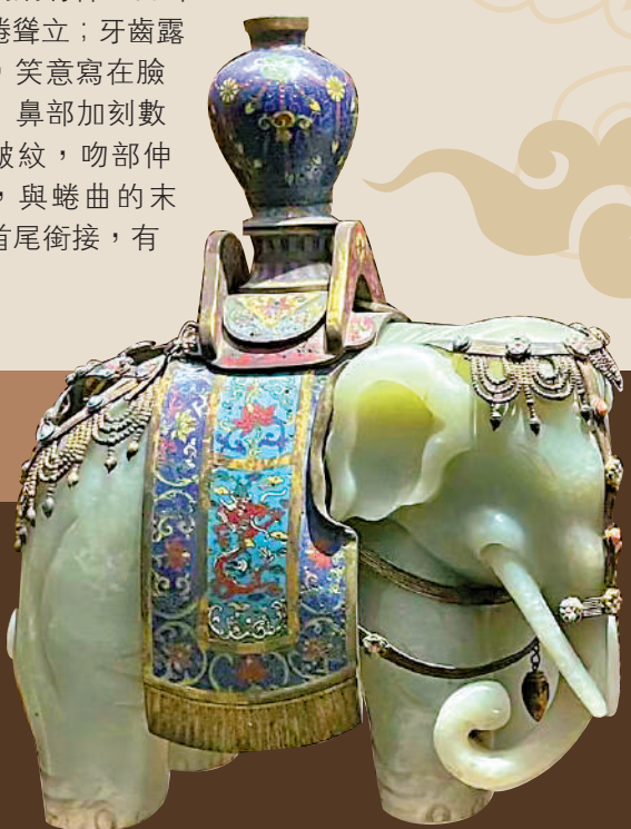
▶「聯展」展品：明清典章文物「太平有象」。中國國家博物館

日期：即日起至2023年1月3日（逢星期一休館，公眾假期除外） 時間：上午9時至下午5時 地點：中國國家博物館（北京市東城區天安門廣場東側） 費用：免費參觀，須於官網預約入場