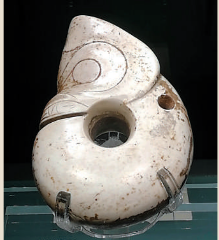
▲「大展」展品：新石器時代「紅山文化」玉玦形龍（玉豬龍）。遼寧省博物館

（作者為中國歷史文化學者、北京市檔案學會副理事長、北京博物館學會學術委員會主任、中國國家博物館研究員）