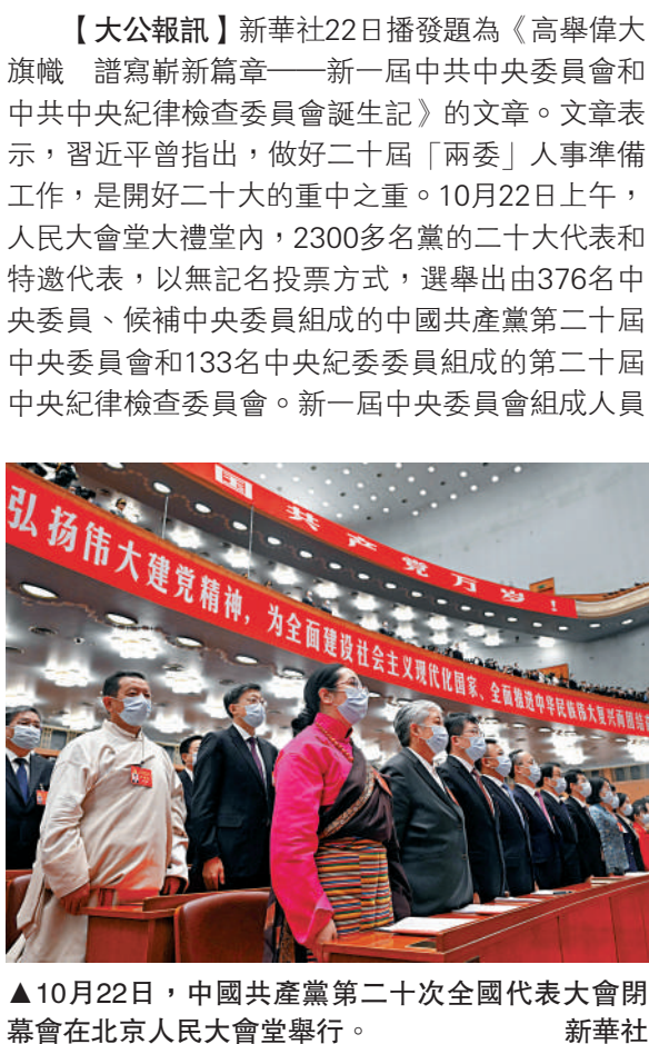
▲10月22日，中國共產黨第二十次全國代表大會閉幕後在北京人民大會堂舉行。

總書記強調，進不進「兩委」，不能對號入座、想當然、依慣例，首先政治上要達標，要深化政治素質考察，避免表面化、形式化，做到看得到摸得着把握得住。「政治問題具有很強隱蔽性和迷惑性，考準考實政治素質是個難題。」考察組同志介紹，這次考察總結借鑒近年來的實踐經驗，進步做深做實政治素質考察。考察組普遍把貫徹落實習近平總書記重要指示批示精神作為考察人選政治素質的重要內容，深入了解貫徹落實的態度、措施、實效。大會期間，各代表團以差額選舉方式對「兩委」人選進行預選。提名二十屆中央委員候選人222名，差額17名，當選205名，差額比例為8.3%。提名候補中央委員候選人188名，差額17名，當選171名，差額比例為9.9%。提名中央紀律檢查委員會候選人144名，差額11名，當選133名，差額比例為8.3%。10月22日上午，人民大會堂大禮堂內，氣氛莊重熱烈。在習近平主持下，大會舉行正式選舉。經過發放選票、填寫選票和投票、計票，出席大會的2300多名代表和特邀代表選舉產生了新一屆中央委員會和中央紀律檢查委員會。肩負9600多萬名共產黨員的殷殷重託，承載14億多中國人民的熱切期盼，新一屆中央領導集體裝裝待發，將帶領全黨全國各族人民，高舉中國特色社會主義偉大旗幟，全面貫徹習近平新時代中國特色社會主義思想，弘揚偉大建黨精神，自信自強、守正創新，踔厲奮發、勇毅前行，為全面建設社會主義現代化國家、全面推進中華民族偉大復興而團結奮鬥。