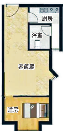
▶彩福大廈51平米一房一廳戶型圖。