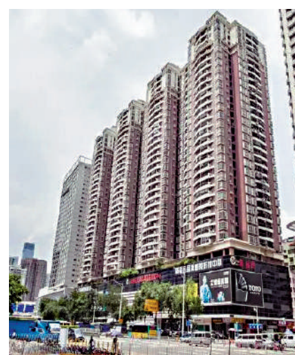
▲彩天名苑由4幢32層高住宅組成，共有單位1188伙。