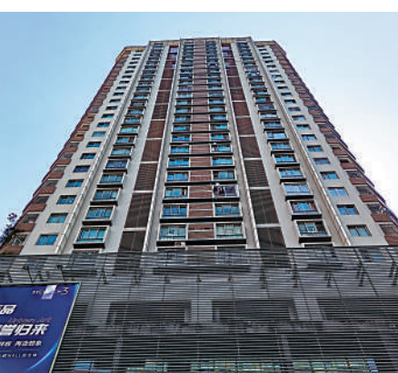
▲彩福大廈於2002年入伙，共提供逾千個單位。

彩福大廈單位建築面積由44至121平米，間隔由一房一廳至三房兩廳，以細單位為主，其中面積51平米一房一廳較受歡迎。開盤時每平米售價為6000至7000元，現在大幅漲價至7萬元左右（約7.7萬港元），目前政府指導價為每平米5.56萬元。據鏈家網數據顯示，彩福大廈9月錄9宗二手成交。