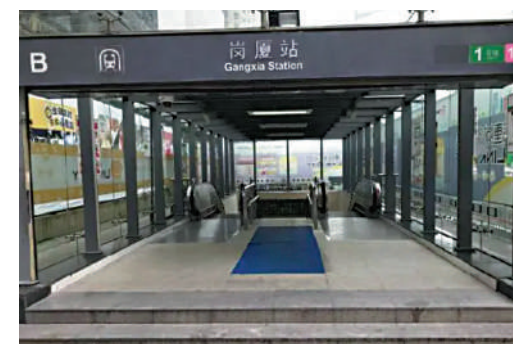
10號線交匯站，人流眾多。