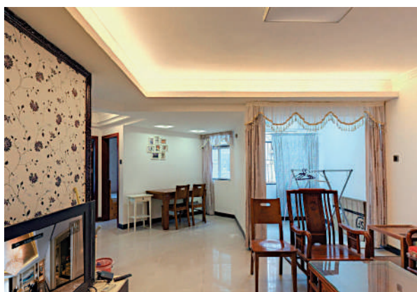
▲彩福大廈單位建築面積由44至121平米，間隔由一房至三房不等。