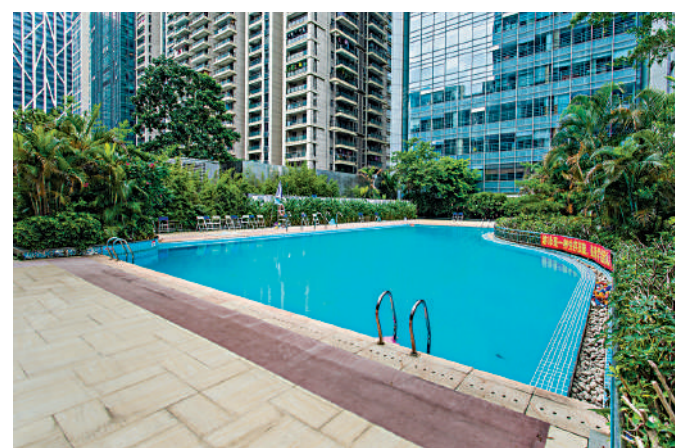
▲星河世紀會所設施完善，設有室外泳池。

屋苑租務市場熾熱，44平米戶型月租6500至7000元，64平米單位月租9000至10000元，租金回報不俗。