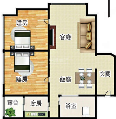
▲星河世紀64平米兩房兩廳戶型圖。