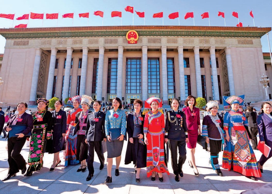
▲10月22日，中共二十大閉幕會後，代表走出人民大會堂。