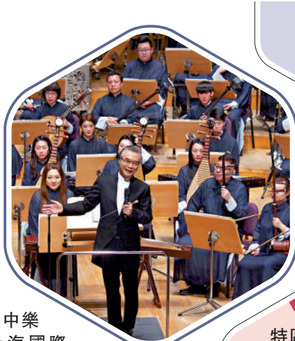
▶香港中樂團在上海國際藝術節「香港文化周」演出。