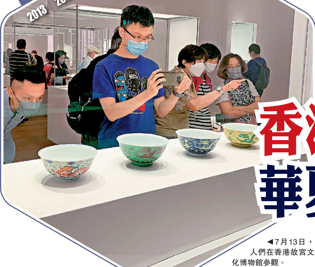
◀7月13日，人們在香港故宮文化博物館參觀。

中共二十大報告提出，以中國式現代化全面推進中華民族偉大復興，並在涉港部分指出，支持香港、澳門更好融入國家發展大局，為實現中華民族偉大復興更好發揮作用。對於香港如何在文化建設方面助力中國式現代化，多位專家及業內人士表示，內地擁有強大的文化市場，作為國際大都市的香港是傳統和現代文化相融合的交匯之處，應當增進與內地及海外各方交流，利用成熟的產業經驗和國際市場條件，抓住新機遇。此外，建成啟用的香港故宮文化博物館也將成為向世界展示華夏文明的重要平台。 大公報記者 江鑫嫻