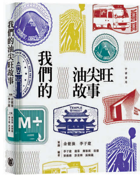
▲在油尖旺看到的社區風情，也是整個香港的縮影。

在香港回歸祖國25周年之際，深信香港這顆東方之珠定能在「一國兩制」獨特優勢下再放異彩。