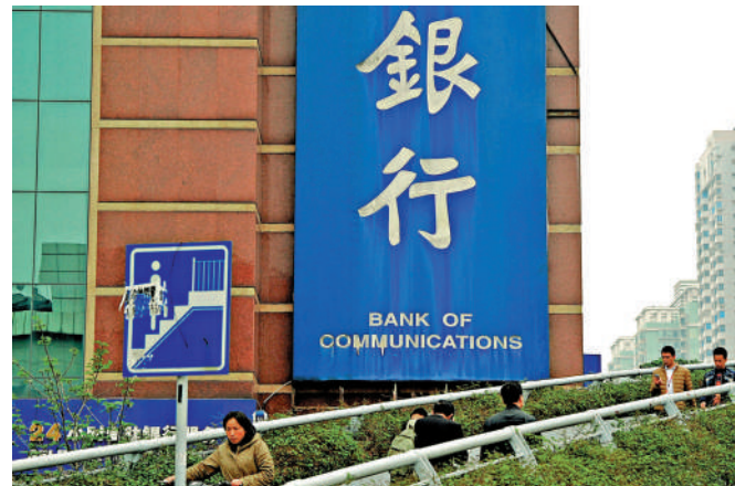
▲六大內銀表示，持續有效發揮大行支柱作用，高效服務實體經濟行穩致遠。