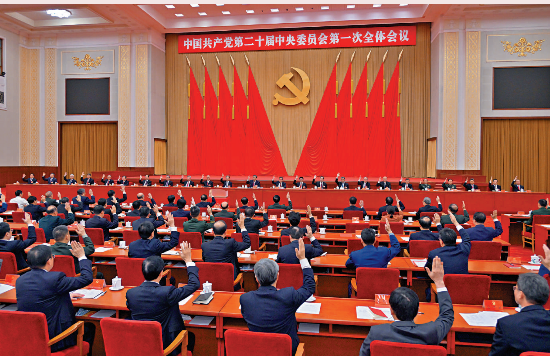
◀10月23日，中國共產黨第二十屆中央委員會第一次全體會議在北京人民大會堂舉行。

新征程是充滿光榮和夢想的遠征。藍圖已經繪就，號角已經吹響。我們要踔厲奮發、勇毅前行，努力創造更加燦爛的明天。