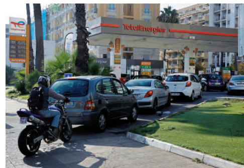
▲法國加油站缺油問題仍未解決，民眾排長隊購買燃油。

英國鐵路工人、碼頭工人、醫護和律師等近期亦發動罷工。英國首相特拉斯應對能源短缺和通脹危機不力，已於20日辭職。諮詢公司Verisk Maplecroft警告指，今冬歐洲的社會動盪和政治不穩定問題恐加劇。