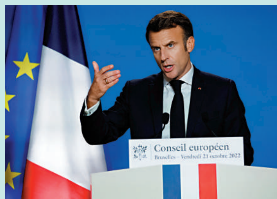
▲馬克龍21日批評美國發戰爭財，賣給歐洲高價天然氣。路透社 ▲法國能源價格上漲，推高生活成本，民眾走上街頭示威。法新社

【大公報訊】綜合彭博社、路透社、商業內幕網站報導：俄烏衝突爆發後，美國一邊煽動歐洲「擺脫對俄能源依賴」，一邊以高價向歐洲出售液化天然氣（LNG）。法國總統馬克龍21日批評美國在貿易和能源政策上搞「雙重標準」，向歐洲出口天然氣的價格比本土市場價格貴了3至4倍。美媒早前披露，一船液化天然氣在美國售價6000萬美元，但運到歐洲可賣出2.75億美元的天價。馬克龍指出，美方雙標行徑影響了跨大西洋貿易的誠意。