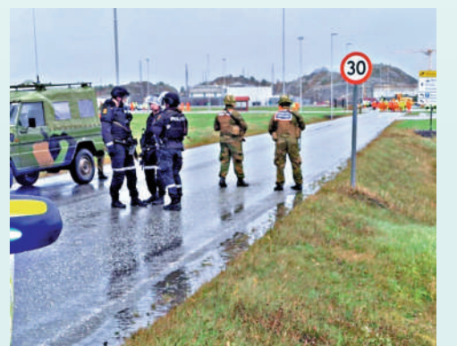
▲挪威一間天然氣加工廠13日收到炸彈威脅，緊急疏散工人。

日，挪威尼哈姆納天然氣加工廠收到炸彈威脅，被迫停工並疏散工人。警方調查後表示虛驚一場。這間工廠負責接收、處理和運送來自挪威第二大離岸天然氣田Ormen Lange的天然氣，英國約20%的天然氣來自該氣田。