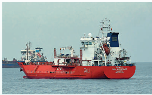
▲歐洲液化天然氣接收設施不夠用，加劇能源危機。

諮詢公司ICIS分析師弗羅利表示，外界預計今冬歐洲氣價將進一步上漲，因此部分LNG船願意多等一段時間再交貨。但航運公司不會無休止地等待，若歐洲遲遲無法解決港口擁堵問題，這些船隻恐駛向其他市場。