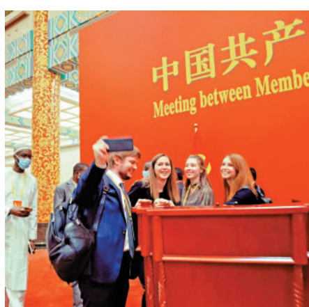
▲外國記者們在金色大廳一起合影留念。