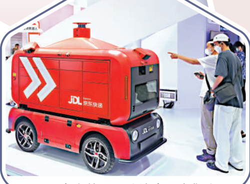
▲民眾在第二屆消博會上參觀京東物流智能快遞車。

過去十年，中國民營經濟發展迅速，在GDP中佔比達28%以上，貢獻了5成以上的稅收、7成以上的技術成果以及8成以上的城鎮勞動就業崗位，民營企業可謂是挑起了高質發展大樑。二十大報告中強調「毫不動搖鼓勵、支持、引導非公有制經濟發展，充分發揮市場在資源配置中的決定性作用」。多位企業家黨代表表示，二十大報告的諸多表述回應了社會重大關切和民營企業的呼聲期盼，及時給民營企業家送來一顆「定心丸」，也有企業家表示，未來將以產業報國、實業強國為己任，助力中國式現代化。 大公報記者 馬曉芳、任芳頡