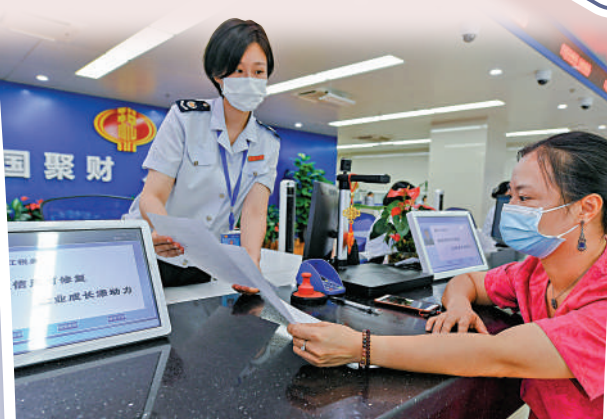
▲近年來中國優化營商環境，助推民營企業發展。