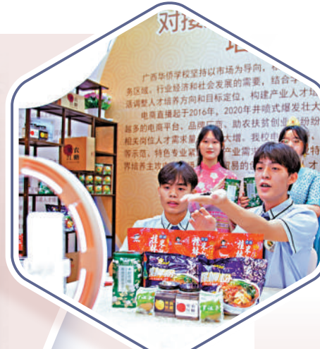
▲直播帶貨氣氛火熱，助力民營經濟。 中新社