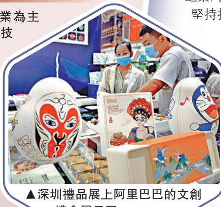
▲深圳禮品展上阿里巴巴的文創禮盒展示區。

優化民營企業發展環境，依法保護民營企業產權和企業家權益，促進民營經濟發展壯大。完善中國特色現代企業制度，弘揚企業家精神，加快建設世界一流企業。 大公報記者馬曉芳、任芳頡整理