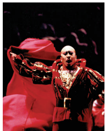
▲田浩江在科隆大劇院演出《浮士德》中的魔鬼梅菲斯特。