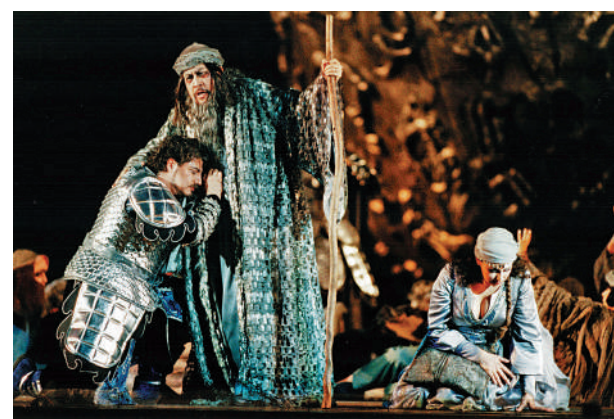
▲田浩江(中)在意大利曾經的角鬥場演出歌劇《圖蘭朵》。