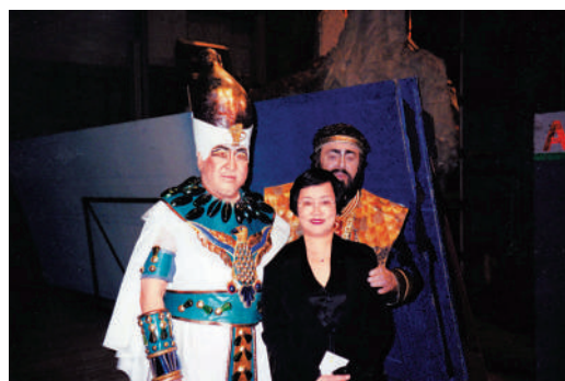
▲《阿依達》演出後台，巴伐洛堤（後排）與田浩江（前排左）和田浩江太太瑪莎合影。

聯合出版集團董事長傅偉中評價新書發布會如同田浩江的「歌友會」。他表示田浩江這本新書可以令讀者看到作者本人對於歌劇、音樂，以及人生的認知。他表示：「田浩江不僅是成功的歌劇表演藝術家，也是一位文學家。字裏行間有令人感動的故事，還有對生活的熱愛。」