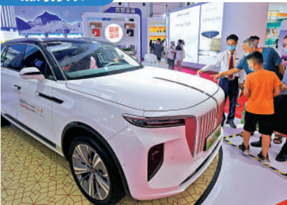
觀眾在消博會參觀紅旗純電SUV。

亮點： 前三季度，服務業增加值同比增長2.3%，比上年上半年加快0.5個百分點。