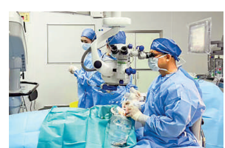
「港澳藥械通」添眼科新藥，圖為醫生為患者做手術。

內地眼科手術染色劑領域空白；將對眼科手術尤其是複雜視網膜手術和白內障手術的撕裂安全起到重要作用，可為眼科醫生減少術中風險，帶來更安全的手術保障。