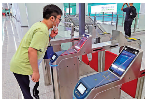
市民體驗「刷臉」進站。

具、通風空調系統做出智能化有效管控，並通過實施樞紐蓄冷項目，自動規劃通風空調最優、最節能的運行方案。