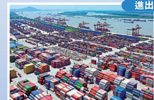
圖為南京龍潭港進出口集裝箱碼頭。

亮點： 國民經濟頂住壓力持續恢復，三季度經濟恢復向好，民生保障有力有效，總體運行在合理區間。