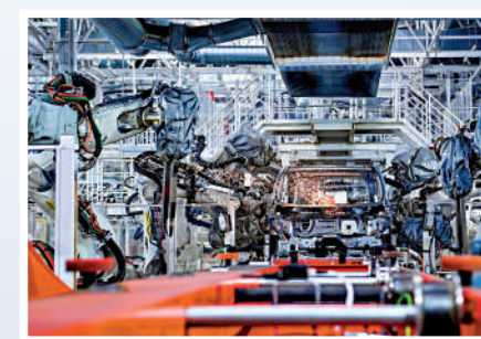
在長春一汽車間內，機器人在焊接車身。