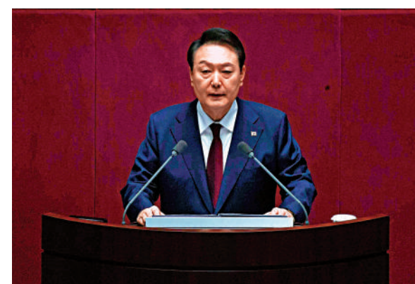
▲韓國總統尹錫悅25日發表施政演說，最大在野黨拒絕出席。

韓國檢察機關19日晚試圖對共同民主黨黨部進行查抄被拒，雙方一度對峙7小時，檢方24日突襲其旗下機構辦公室，沒收相關文件。共同民主黨認為，檢方為調查京畿道城南市大莊洞地產開發弊案，而查抄其旗下機構屬於政治報復行為，因此該黨議員一致決定抵制總統施政演說。