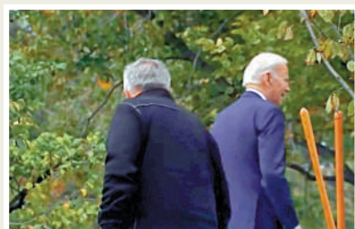
▲拜登在白宮花園內迷路。

今年4月，拜登在北卡羅來納州一所大學發表演講後轉身與空氣說話，還跟空氣握起手來。拜登當時的怪異行為引起熱議，共和黨參議員克魯茲等人表示拜登出現認知退化跡象。