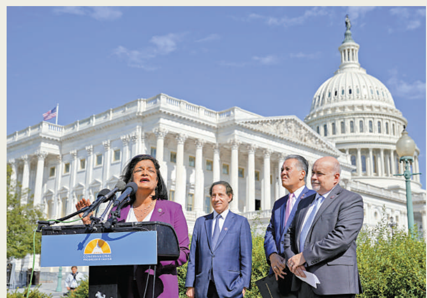
▲美國國會眾議員賈亞帕爾(左一)領導的民主黨團體敦促拜登審視對烏政策。

兩名知情人士表示，拜登政府可能會在本周內動用「總統撥款權」，無需經過國會批准，從美國的庫存中拿出裝備提供給烏克蘭。另有一名美國官員表示，拜登正在考慮於本週晚些時候簽署一份涉及總統撥款權的協議，其中可能包括最近宣布的7億美元軍援的一半，不清楚是否包括「鷹式」防空導彈系統。