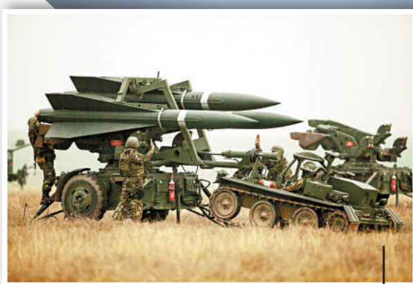
▲美國擬向烏克蘭提供的「鷹式」防空導彈系統。