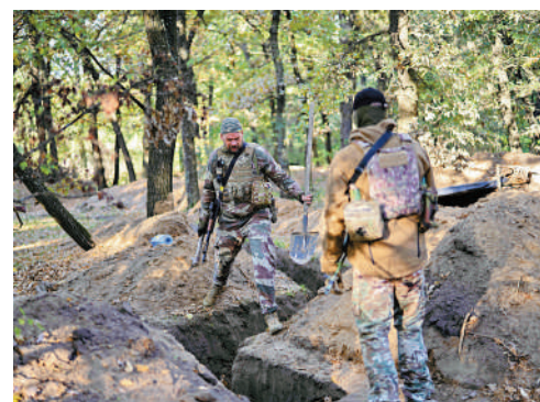
▲烏軍察看俄軍在赫爾松地區掘的戰壕。