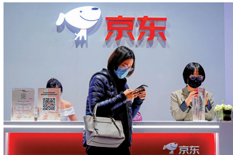
昨日大市的「主戰場」仍然在科技板塊，大部分股份反彈，京東升5%居首。

本地銀行股，兩個板塊的主要成員都被沽到成「軟腳蟹」。例如滙控(00005)，前日一柱擎天，逆流而升，昨日在公布第三季業績後即刻「散晒」，雖業績符合預期，甚至略超估計，但淡友已不理會這些，硬生生將「大笨象」壓至全日低位39.95元收市，重創5.1%。與此同時，恒生(00011)、中銀香港(02388)分別跌3.8%和3.3%，也是不輕的跌幅。至於本地地產股，可以用「越跌越跌」來形容。長實(01113)、新地(00016)、新世界(00017)、恒地(00012)、信置(00083)等，跌幅在2%至3%不等。