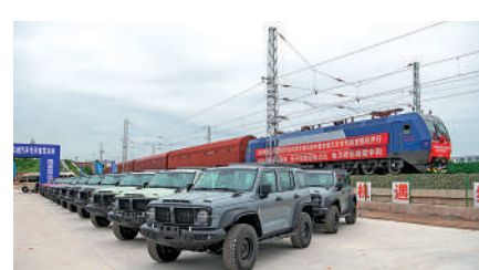
▲建銀下調長汽明年銷量預測，以反映疫情影響物流與供應鏈。等。不過，考慮到高利潤率車款貢獻擴張及銷售均價逐漸改善，對明年兩年盈利分別升9%及2%。即使行業本地市場復甦受疫情防控措施所影響，維持對長汽長期業務展望正面看法，目標價由18.1元降至10.6元，評級「跑贏大市」。

的全球市場環境，海外市場如歐盟或東盟市場提供了長期機遇的同時，亦可能在短期內為集團帶來營運挑戰，對於集團目標到2025年出口達100萬輛，該行對此持謹慎樂觀態度。建銀國際發表報告，指長汽第三季業績強勁，純利按年升81%至25.6億元人民幣，按季則跌36%；核心純利按季升約160%。第三季毛利率按年升520點子至22.5%，按季亦升270點子。對於明年新能源車定價，長汽擬採取更市場化主導策略。報告指成本上升帶來短期波動，另下調長汽今年銷量預測12%及14%，至分別17萬及22萬輛，以反映疫情影響物流、供應鏈問題及消費疲弱