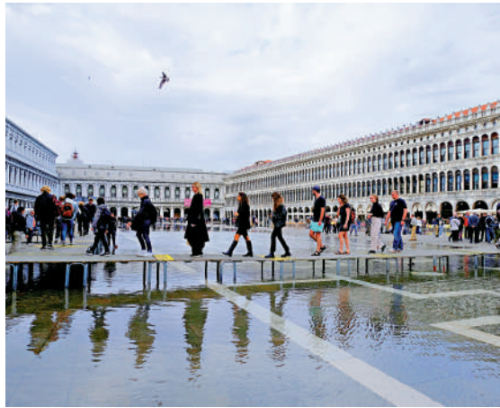
▲威尼斯有廣場被水浸，民眾25日走在搭建的T路透社台上。