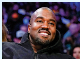
▲ Adidas 與 Kanye West合作的Yeezy球鞋將停產。