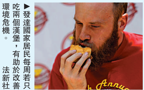
吃兩個漢堡，有助於改善環境危機。法新社

【大公報訊】綜合《衛報》、CNN報道：最新研究顯示，若要避免氣候危機帶來嚴重破壞，發達國家應減少肉類消耗量，民眾每周最多吃兩個漢堡。此外，公共交通的覆蓋範圍應該增加到目