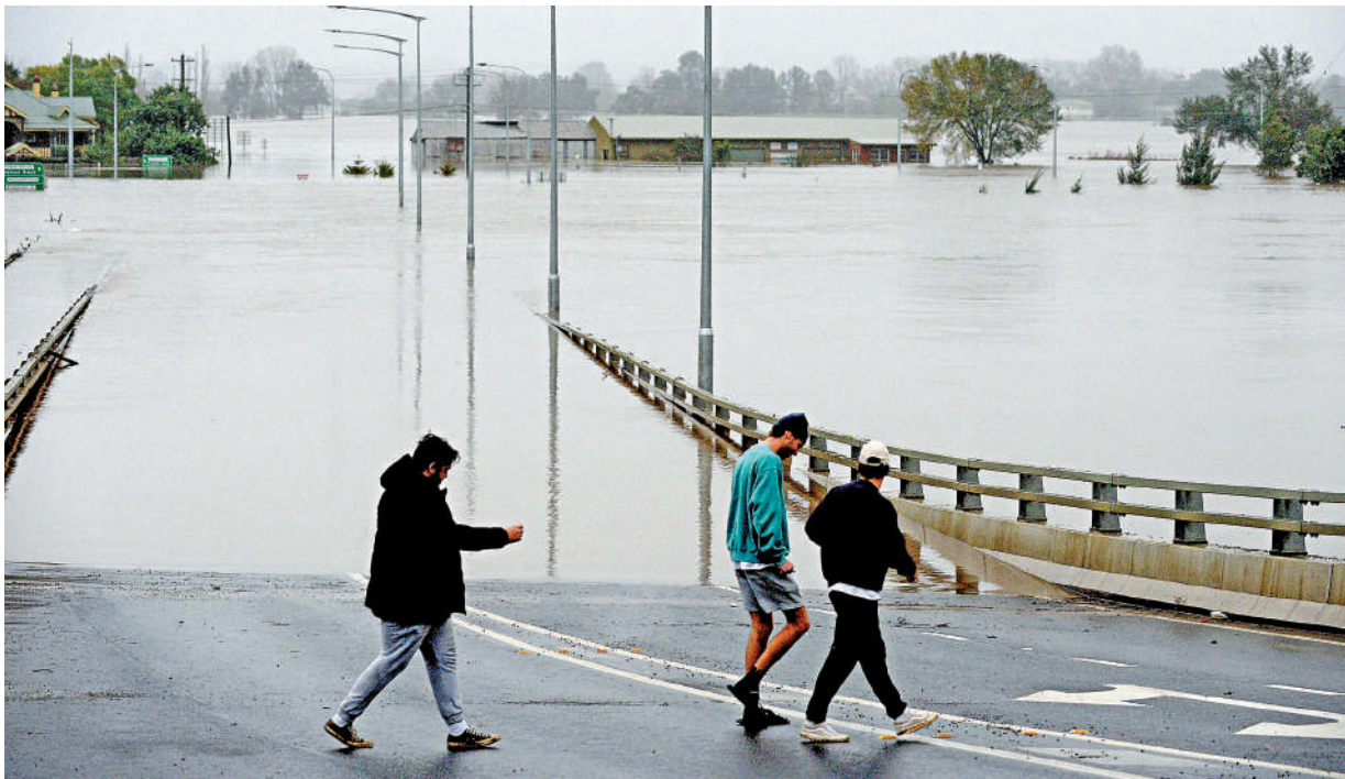
▲澳洲今年以來發生4次洪災，圖為悉尼居民走過幾乎被水淹沒的溫莎橋。