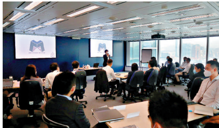
▲「洗黑錢專家」團隊今年10月1日正式成立，他們在今年9月接受了為期10天的培訓，並通過嚴格考核。

香港打擊洗錢及防制恐怖分子資金籌集的政策、財務行動特別組織（FATF）建議和洗黑錢類型報告、法證會計的概念和技能、香港不同行業的監管法規，以及模擬法庭，進行出庭提供專家證供的訓練。另外，有5名來自廉政公署及海關的客席學員參加是次培訓，以進一步提升香港執法機構在反洗黑