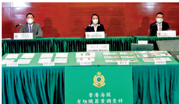
▲海關偵破一宗涉及變賣黃金及鈹金等貴金屬的懷疑洗黑錢案件，涉款約35億元。

兩名被捕男子分別報稱任職工程技工及工人，月入分別1萬及2萬元，但其名下的公司戶口處理大量極大額交易，單筆最大額達8千萬港元，與其財務背景不相稱，引起海關懷疑，他們涉嫌於2020至2021年間利用公司戶口，處理極大金額的可疑交易，其中涉及多達8噸來歷不明的黃金及鈹金，懷疑