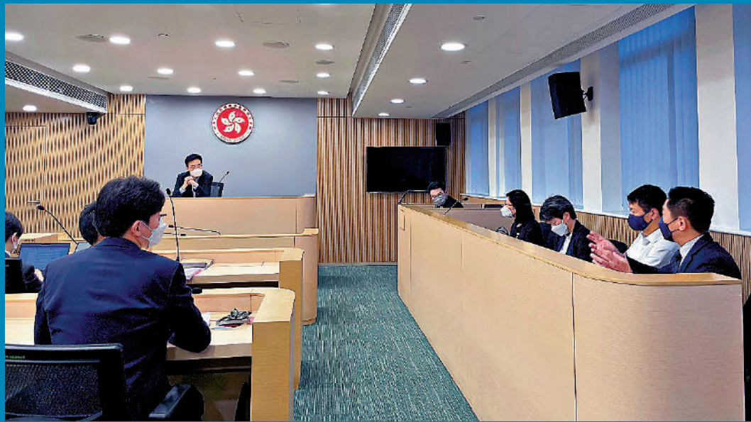
◀警方新設立「洗黑錢專家」團隊，進一步提升舉證檢控洗黑錢罪行的能力。