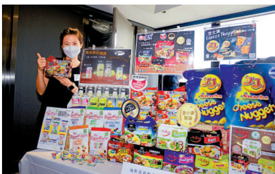
▲「第9屆香港美食嘉年華」將於周六在葵涌運動場舉行。

今個周末又有好去處，由廠商會舉辦的第9屆香港美食嘉年華，將於本周六（29日）至下周日（11月6日），一連九天在葵涌運動場舉行。場內有超過290個攤位，今年新增「日韓美食區」。會場優惠多多，部分產品低至一折，並有「1元產品」推售。考慮到疫情風險，場內不設試食。