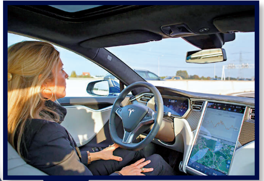
▲2016年，Tesla展示其自動駕駛系統，手毋須放在方向盤上。