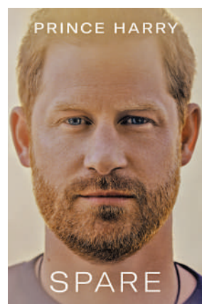
▲英國哈里王子即將在明年1月推出的回憶錄《備胎》。

里來說，他終於可以訴說自己的故事了。」據報導，長達416頁的回憶錄除了會以荷蘭語、葡萄牙語等16種語言版本發行之外，