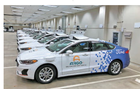
▲福特汽車與Argo AI合作自動駕駛技術位於匹茨堡的車庫。

4級自動駕駛是「這個時代最難的技術問題，甚至比人類登上月球還要困難」。自動駕駛技術從高到低分為5個層級，4級自動駕駛指的是「不需要人力掌握方