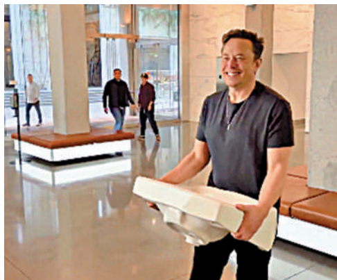
▲Tesla創辦人馬斯克26日抱著一個洗手水槽進入推特總部。

【大公報訊】綜合路透社、彭博社報導：Tesla創辦人馬斯克收購社交巨頭推特（Twitter），須在美國當地時間10月28日下午5點前完成。馬斯克26日在推特公布了一段自己抱著一個洗手水槽（sink）進入推特總部的視頻，暗示收購推特已經定局。紐約證券交易所網站顯示，推特股票將從28日起開始暫停交易。