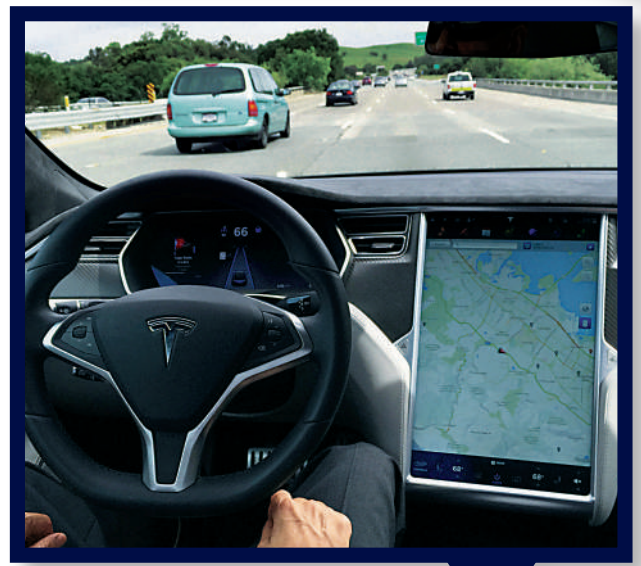
▲圖為進入自動駕駛模式的Tesla Model S。路透社

據路透社引述三名知情人士報導，美國司法部正在調查Tesla是否對其自動駕駛系統（Autopilot）的功能進行虛假宣傳，誤導消費者、投資者和監管機構。調查將聚焦於Tesla是否給消費者帶來「虛假的安全感」，導致駕駛員有可能在駕駛時鬆懈，最終造成致命後果。