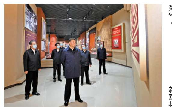
▲習近平等在延安革命紀念館參觀《偉大歷程——中共中央在延安十三年歷史陳列》。 參觀《偉大歷程——中共中央在延安十三年歷史陳列》後：「全黨同志要發揚鬥爭精神、提高鬥爭本領，堅決戰勝前進道路上的各種困難和挑戰，依靠頑強鬥爭打開事業發展新天地。」