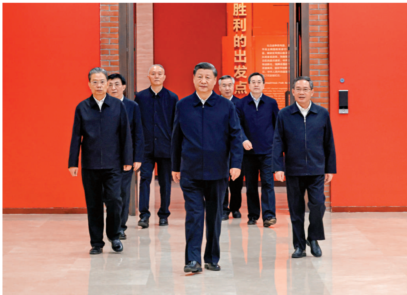
▲10月27日，中共中央總書記、國家主席、中央軍委主席習近平帶領中共中央政治局常委李強、趙樂際、王滬寧、蔡奇、丁薛祥、李希，瞻仰延安革命紀念地。這是習近平等在延安革命紀念館，參觀《偉大歷程——中共中央在延安十三年歷史陳列》。

【大公報訊】據新華社報道：中共二十大閉幕不到一周，中共中央總書記、國家主席、中央軍委主席習近平帶領中共中央政治局常委李強、趙樂際、王滬寧、蔡奇、丁薛祥、李希，專程從北京前往陝西延安，瞻仰延安革命紀念地，重溫革命戰爭時期黨中央在延安的崢嶸歲月，緬懷老一輩革命家的豐功偉績，宣示新一屆中央領導集體廣續紅色血脈、傳承奮鬥精神，在新的趕考之路上向歷史和人民交出新的優異答卷的堅定信心。習近平強調，要弘揚偉大建黨精神，弘揚延安精神，堅定歷史自信，增強歷史主動，發揚鬥爭精神，為實現黨的二十大提出的目標任務而團結奮鬥。