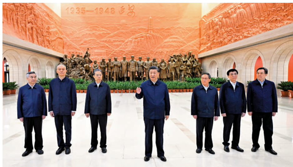
▲習近平在延安革命紀念館參觀《偉大歷程——中共中央在延安十三年歷史陳列》結束時發表重要講話。