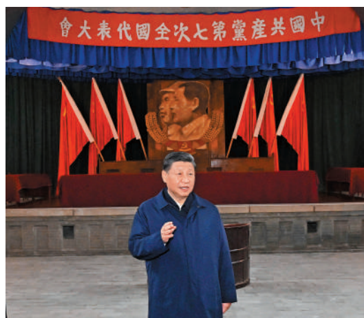
▲習近平在楊家嶺瞻仰中共七大會址。 在中共七大會址：「黨的七大在黨的歷史上具有重要里程碑意義，標誌着我們黨在政治上思想上組織上走向了成熟。」