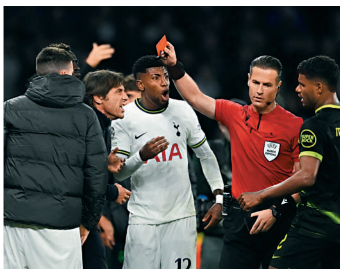
▲熱刺主帥干地（左二）被球證（右二）以紅牌驅逐出場。