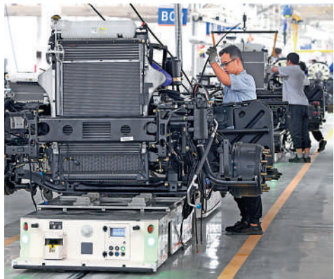
▲今年三季度末，製造業中長期貸款餘額8.75萬億元，同比增長30.8%。

【大公報訊】據新華社報道：國務院關於金融工作情況的報告28日提請十三屆全國人大常委會第三十七次會議審議。報告顯示，今年國家進一步加大對實體經濟的金融支持力度。