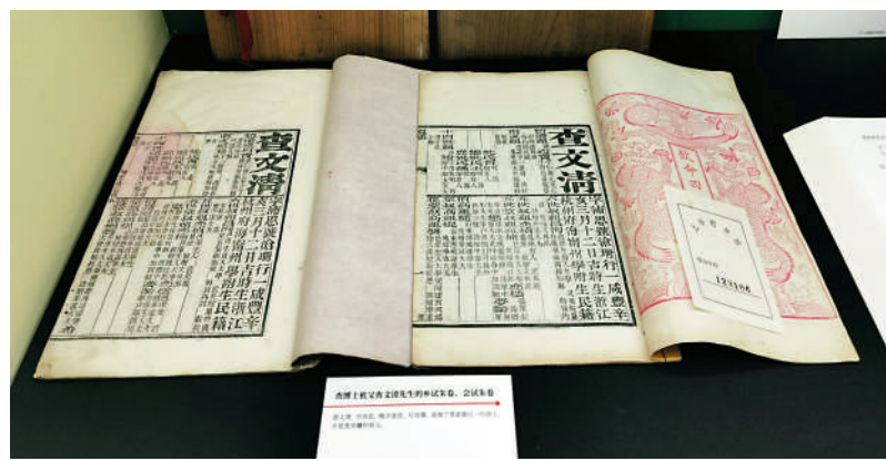
▲上海圖書館館藏，金庸的族譜《海寧查氏族譜》，和金庸祖父查文清於清光緒丙戌（1886）年考中進士的《會試硃卷》。