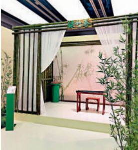
▲展覽現場還原了不少書中的場景，圖為「綠竹巷」。

俠侶》、《倚天屠龍記》、《俠客行》、《白馬嘯西風》、《飛狐外傳》均以這種方式出版。