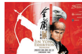
▲「金庸展——上海站」海報。