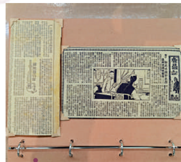
▲刊登金庸作品的剪報，左為刊登於《新晚報》上《書劍恩仇錄》，這是金庸創作的首部長篇武俠小說。