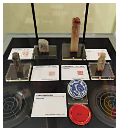
▲金庸使用過的印鑒。